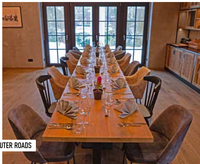
KLEINES OUTER ROADS